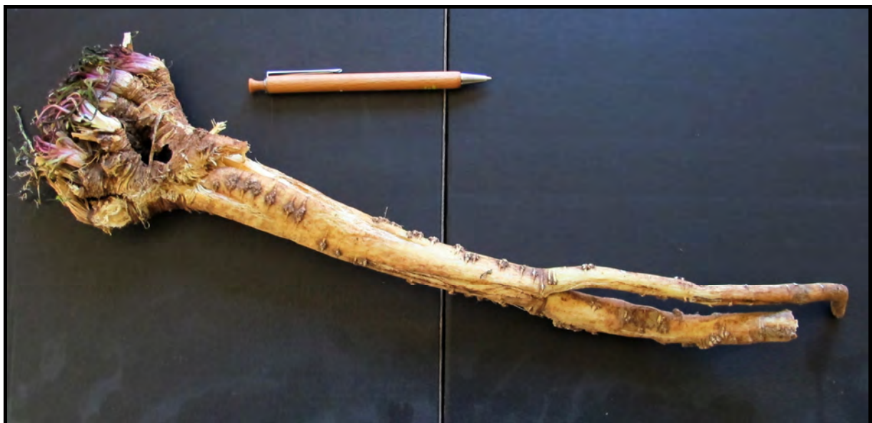
Abb. 2 obere Wurzel von Bunias orientalis , ausgestochen mit einem Ampferstecher am 5.2.2013

Einjährige bzw. kleine Pflanzen können bei möglichst feuchtem Untergrund mit Hilfe eines Unkrautstechers samt der Wurzel herausgezogen werden. Mittlere und größere Exemplare lassen sich dagegen nicht einfach entfernen. Bei Vorversuchungen habe ich verschiedene Techniken und Geräte getestet. Am besten eignen sich Unkrautstecher mit langem Stiel. Die Wurzel sollte damit vor allem gelockert und herausgehoben, eventuell tief abgestochen werden. Ich habe auch einen Ampferstecher ausprobiert. Damit lassen sich unter Umständen bei weichen Böden über 40 cm lange Wurzeln komplett herausziehen. Oft reißen diese aber oben ab, so dass ich noch nicht abschließend sagen kann, welches Gerät die besseren Erfolgchancen erwarten lässt. Wahrscheinlich muss das bei jedem Untergrund neu ausprobiert werden.