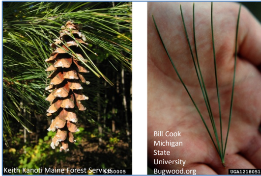
Keith Kanoti Maine Forest Services 0005

5 Nadeln aus Kurztrieb, längliche Zapfen, bis zu 20cm lang